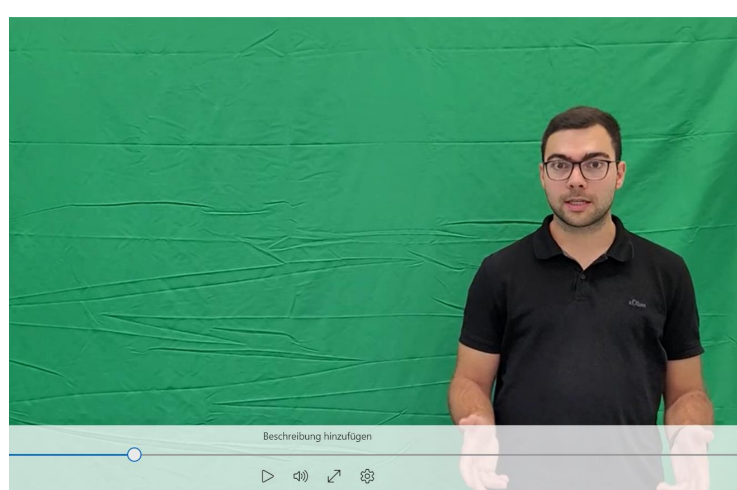
Erste eigene Versuche vor dem Greenscreen

Studierende erhalten die Möglichkeit, eigene Erklärvideos zu geschichtlichen Themen zu erstellen. Diese können sie als (Teil-)Prüfungsleistung im Seminar einbringen.